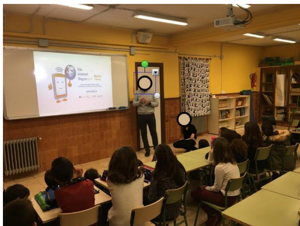
Exemplo de charla con cibercooperante

Poden visitar a páxina Cibercooperante de INCIBE e concretar un día para que un experto imparta unha charla.