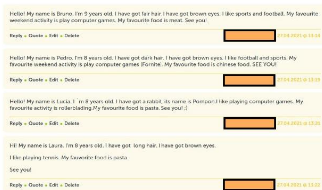
Exemplo de presentación no Foro

Os estudantes acceden ó debate aberto na sección «foro» e escriben unha breve presentación, incluíndo o seu nome, gustos acerca de deportes, animais e comida. Ademais, invítanos a que interactúen co resto de socios e que respondan polo menos a 3 mensaxes. Utilizan a lingua vehicular da actividade.