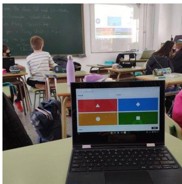
Alumnado realizando a avaliación

Os estudantes acceden ó TwinSpace e completan o cuestionario.