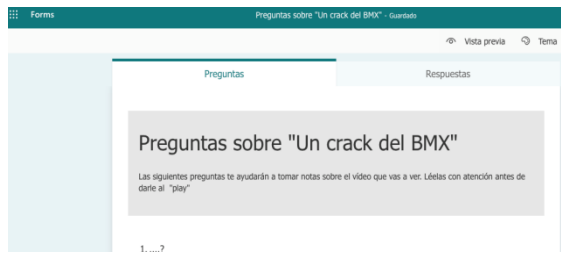
Imatge 2_qüestionari amb preguntes sobre el vídeo

L'objectiu de les preguntes és facilitar la reflexió sobre els diferents punts que s'observen en el vídeo (ús excessiu/obsessiu del mòbil, l'empremta digital, conseqüències a curt i llarg termini...).