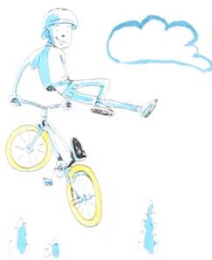
Imaxe 1_fragmento do vídeo

Aínda que o vídeo está en español, enténdese perfectamente sen audio, de modo que o idioma non será un problema para ningún alumno.