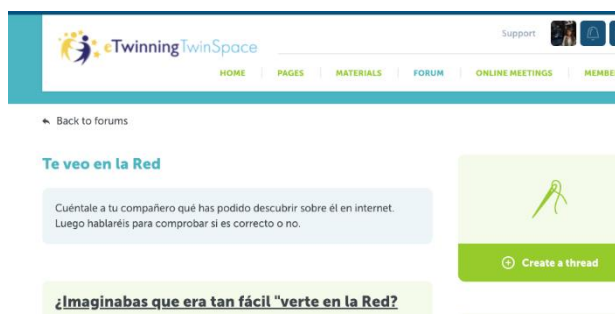
Imaxe 6_fío no foro