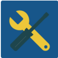
Tutorial de Madmagz