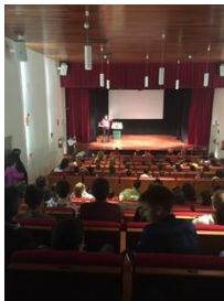
imaxe 2- charla presencial

Paso 4.- pídesse permiso para gravar a charla presencial e compartila posteriormente co resto de socios. Se se fai videoconferencia, participan todos directamente.