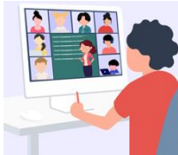
imaxe 3- videoconferencia

Nota: a videoconferencia prográmase no Twinspace, pero convén ter un plan B por se houbo problemas técnicos de última hora. Pódese falar cos demais socios e acordar outra plataforma (Hangouts, Google meet, Jitsi, ou similar).