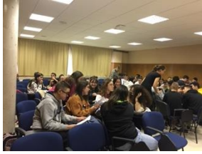
imaxe 1- traballando na aula

Paso 4.- pídesse permiso para gravar a charla presencial e compartila posteriormente co resto de socios. Se se fai videoconferencia, participan todos directamente.