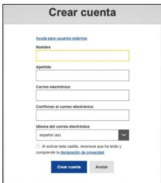
Figura 1. Captura de pantalla que muestra la página de inicio para crear el EU login . Elaboración propia (SNA-INTEF). Captura tomada de ESEP . Licencia CC BY SA

Pincha aquí para crear una cuenta EU Login