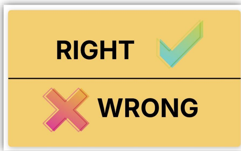
Imagen 1 . Sin título. Elaboración propia (INTEF). Licencia CC BY SA

eTwinning constituye la mayor red de centros educativos de Europa. Todas y cada una de las personas que lo conforman construyen cómo es. Aquí exponemos unas cuantas reglas básicas para que eTwinning siga siendo seguro y divertido para todos.